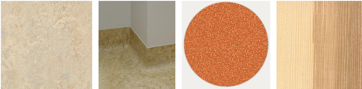
podlaha sokl látka dřevo