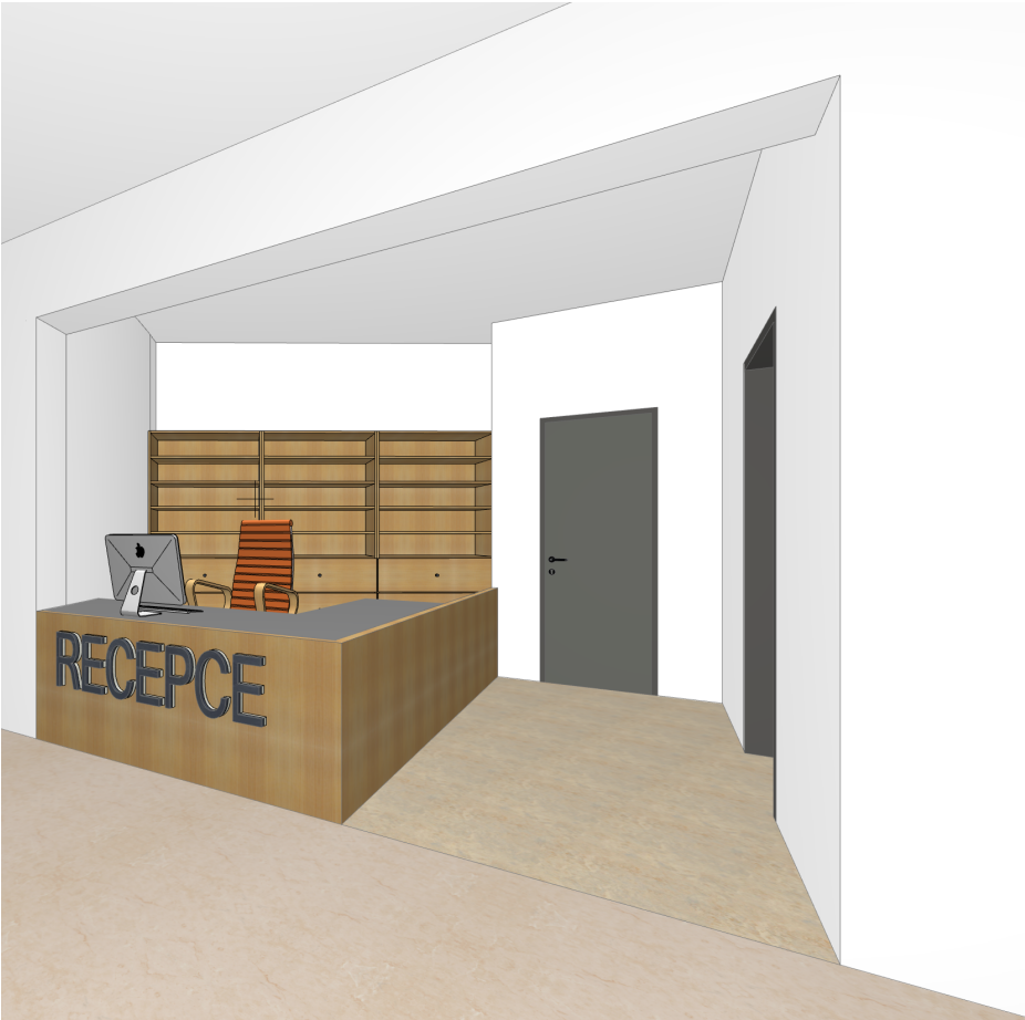
vizualizace pohledu do recepcce